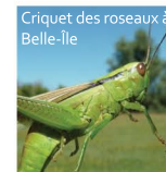
Criquet des roseaux à Belle-île