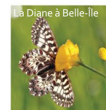
La Diane à Belle-île