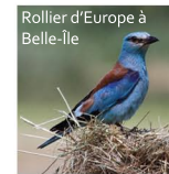
Rollier d'Europe à Belle-île

Enfin, hôte illustre de l'ENS, le Castor d'Europe dont la gestion de l'eau bénéficie à toute la biocénose du site en maintenant les conditions de milieu nécessaires au cycle biologique de nombreuses espèces. Un concours précieux dans la gestion du site !