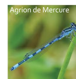
Agrion de Mercure