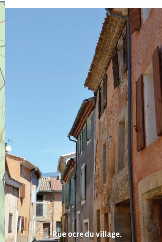
Rue ocre du village.