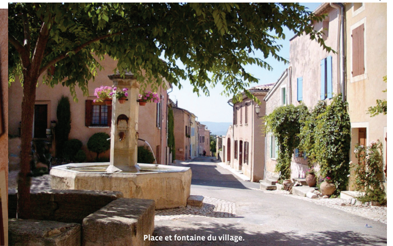
Place et fontaine du village.

Balissage : GR (blanc/rouge) et PR (jaune)