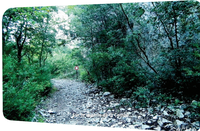
Sur le chemin de la Combe.

Aiguier (cavité servant de réserve d'eau pour l'activité pastorale).