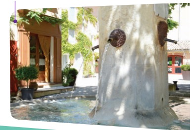
La fontaine de Flassan.

7 Descendre à gauche pour rejoindre l'entrée de la combe 2 . Prendre à droite pour rejoindre le parking.