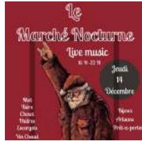
©Marché de Noël nocturne