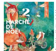
©marché de Noël à saint martin de la brasque