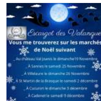
© Les "Escargots des Valanques" sur vos marchés de Noël