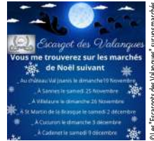
©Les Escargots des Valanques sur vos marchés de Noël