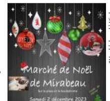
©Marché de Noël à Mirabeau